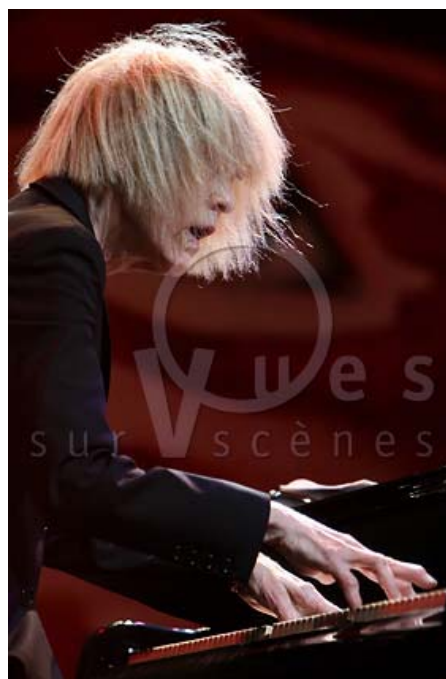
Carla Bley