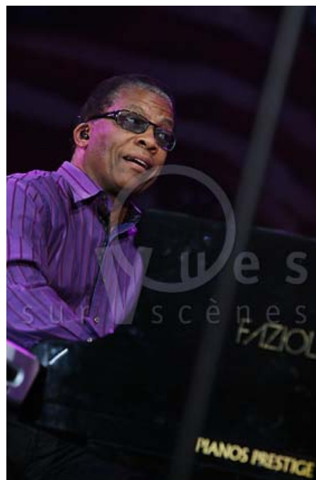
Herbie Hancock