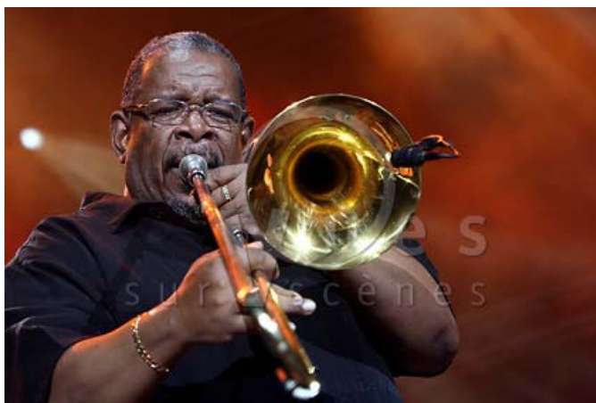
Fred Wesley