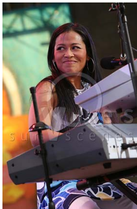
RAD

Wunmi ou Simphiwe Dana. On retiendra notamment les pas de deux lancés par cette jeune danseuse qui court, saute et danse, bousculant Pee Wee Ellis ou Fred Wesley. Mais au final, l'incertitude demeure. Même si, çà et là l'orchestre se trouve et vous embarque dans un soul-funk efficace, il retombe quelques instants après.