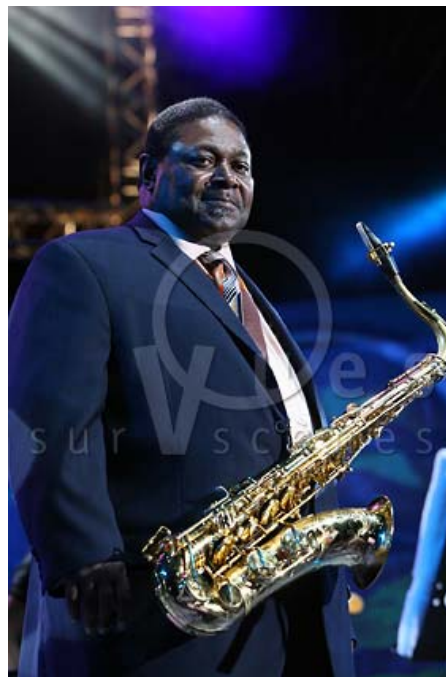
Pee Wee Ellis