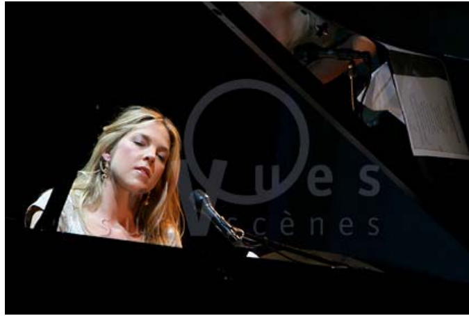
Diana Krall