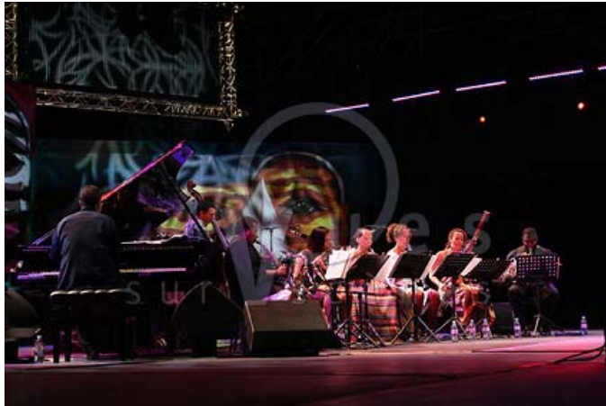
Wayne Shorter Quartet / Imani Winds

On se souvient d'un précédent passage à Vienne où une telle osmose s'était créée, sous les yeux d'un public ébahi. Cette fois-ci, rien de tel. L'écriture appliquée du quintet new yorkais ( Imani Winds ), qui n'en est pas à son coup d'essai en matière d'aventure jazzy, n'est ici pas en cause. Mais le lien avec le célèbre quartet qui lui succède n'opère pas. En revanche, celui-ci aura rappelé tout l'intérêt de sa démarche, John Patitucci lui donnant toute son assise précieuse. Même si Danilo Perez dévie trop volontiers sur des rythmes salsas, avec un Brian Blade rigoureux et attentif, le contrebassiste vient en effet escorter Wayne Shorter, quelque peu troublé, dans ses rares interventions, plus réussies au soprano. Si le concert ne fut donc pas tout à fait abouti, en revanche, et c'est tout son intérêt, il ouvre des pistes précieuses sur des alliances ou des rencontres peu usitées.