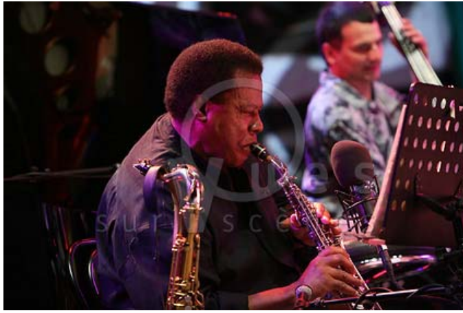
Wayne Shorter / John Patitucci

On se souvient d'un précédent passage à Vienne où une telle osmose s'était créée, sous les yeux d'un public ébahi. Cette fois-ci, rien de tel. L'écriture appliquée du quintet new yorkais ( Imani Winds ), qui n'en est pas à son coup d'essai en matière d'aventure jazzy, n'est ici pas en cause. Mais le lien avec le célèbre quartet qui lui succède n'opère pas. En revanche, celui-ci aura rappelé tout l'intérêt de sa démarche, John Patitucci lui donnant toute son assise précieuse. Même si Danilo Perez dévie trop volontiers sur des rythmes salsas, avec un Brian Blade rigoureux et attentif, le contrebassiste vient en effet escorter Wayne Shorter, quelque peu troublé, dans ses rares interventions, plus réussies au soprano. Si le concert ne fut donc pas tout à fait abouti, en revanche, et c'est tout son intérêt, il ouvre des pistes précieuses sur des alliances ou des rencontres peu usitées.