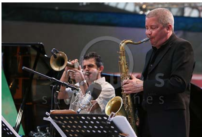
Andy Sheppard/Paolo Fresu

Le lendemain, la première partie - pas si éloignée de l'entreprise de Hancock - signe le grand retour à Vienne de Carla Bley . Conseil aux absents : précipitez-vous sur l'enregistrement partiel normalement réalisé par France Inter (qui n'a daigné – dommage - retransmettre en direct que quatre soirées de la quinzaine viennoise). Car le moment fut magnifique : pour fournir à Paolo Fresu - grâce et profondeur - l'écrin souhaité, la jeune vieille dame, coupe de cheveux éternelle, hiératique à son piano démesuré, a réuni autour d'elle, et de lui, Steve Swallow , of course, Billy Drummond (dms) bien sûr et surtout Andy Sheppard , sax complet. Ce fut entre les deux cuivres une myriade d'entrecroisements légers et subtils, où la dame se glissa avec délicatesse. Evidemment, et heureusement, le héros de la fête est bien resté le trompettiste, dont la stature ne cesse de s'amplifier. Sur cette même scène où ont défilé, tout au long de ces 28 années, les plus grands de l'instrument, Fresu apparaît fulgurant et d'une clarté absolue, même si, poussé par son aînée, il s'écarte pour l'occasion de ses couleurs habituelles.