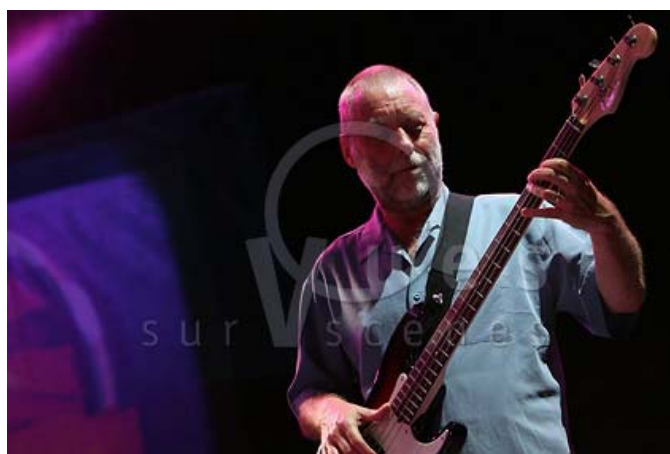
Dave Holland