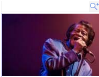
Le chanteur James Brown, le 4 novembre 2006 à Prague