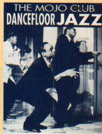
Vorreiter in Sachen Dancefloor-Jazz: Der Mojo Club lädt zum Tanz.