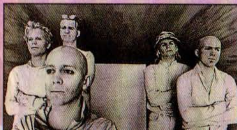
Sind nicht in den Mehltopf gefallen: die Inchtabokatables.