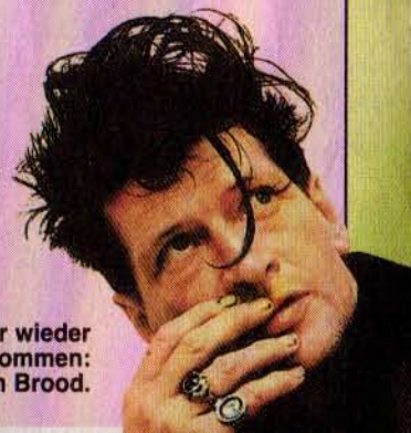
Immer wieder gern genommen: Herman Brood.